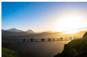
Berg- und Talfahrt Abendauffahrt Ascent & decent evening ascent

Come a little closer to the stars. There is a special evening ascent of Stubnerkogel cable car. An unforgettable experience for romantics and nature lovers with musical entertainment during the sunset on top of the mountain.